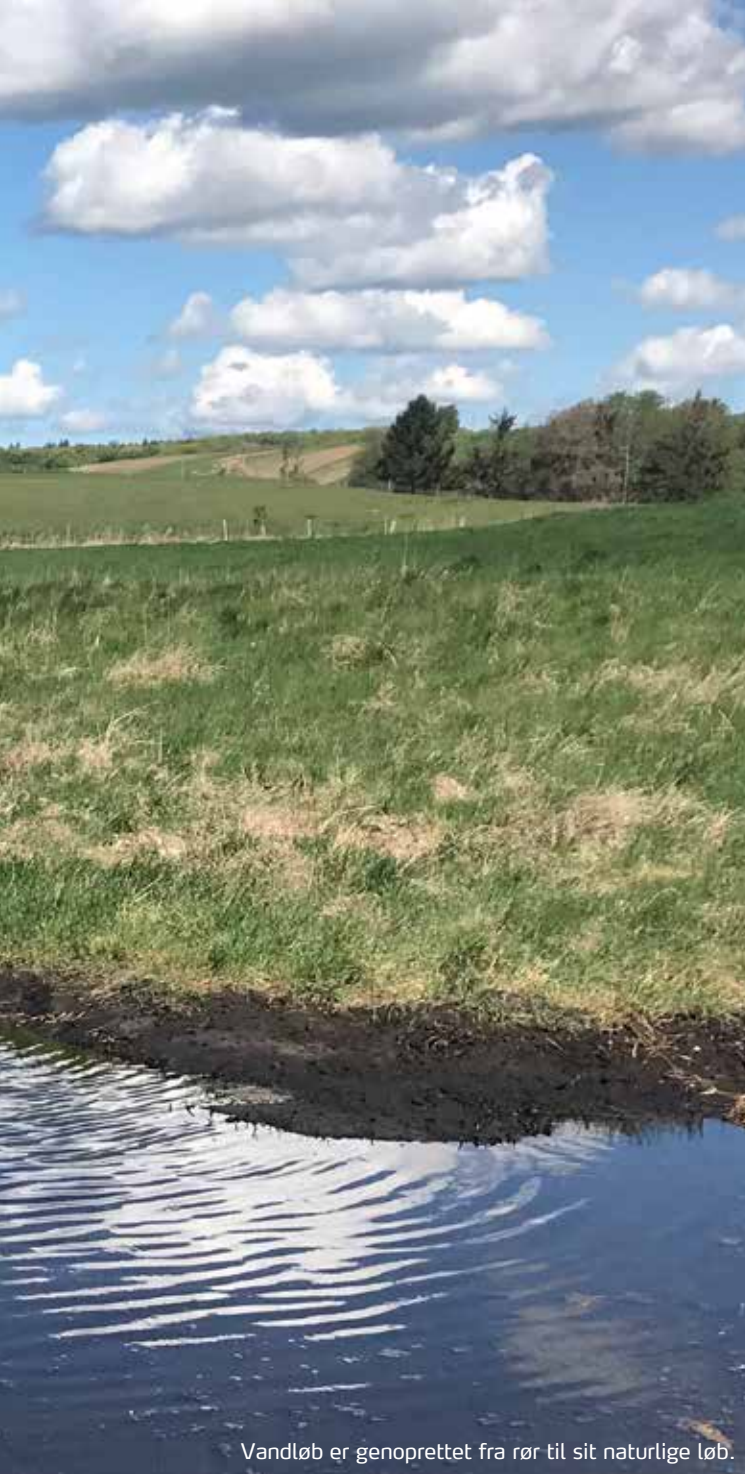
Vandløb er genoprettet fra rør til sit naturlige løb.