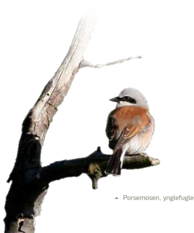
▲ Porsemosen, ynglefugle.