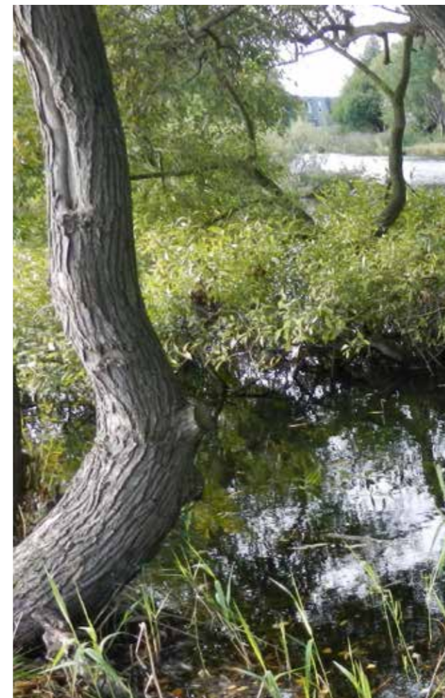
▼ Balsmosen i Smørum 2013.